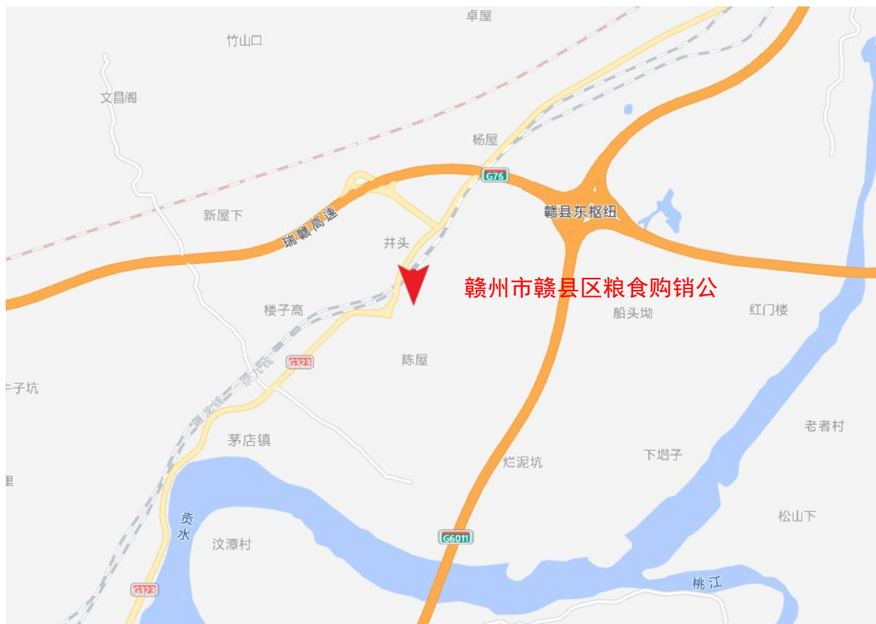
图 2.3-1 建设项目地理位置图

本项目位于赣县区茅店镇，赣州高新技术产业开发区稀土二路 1 号。东北面与赣州朗固新材料科技有限公司共围墙，西北为保留山体，山顶有植被，山坡为中风化岩石，坡度约 60°，高度约 30m；东面为稀土二路，隔路为空地；南面为稀土四路，隔路为美平电器制品(赣州)有限公司厂房和人才公寓；西面为 323 国道，隔路为京九铁路和赣龙铁路，京九铁路和赣龙铁路呈东北-西南走向，距离本项目厂界大于 100m。在厂区南面设置主要 1 个主出入口，东面依托原有出入口。项目周边安全防护距离范围无其他公共重要设施，无自然风景区等，周围环境条件良好，项目选址能满足项目安全生产的需求。